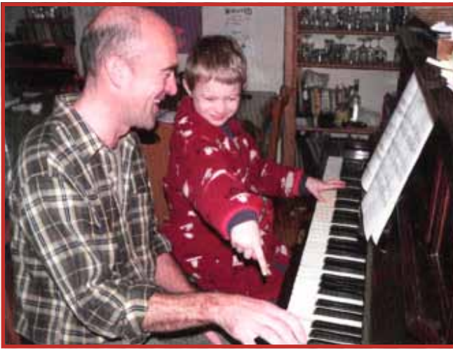
Vader en zoon aan het oefenen.